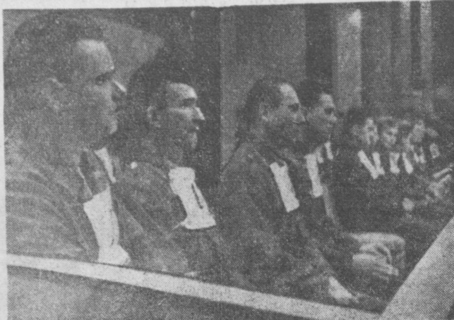
Сидя над палачами из гитлеровского студинки на скамье подсудимых. На снимке: председатель пресс-конференции...