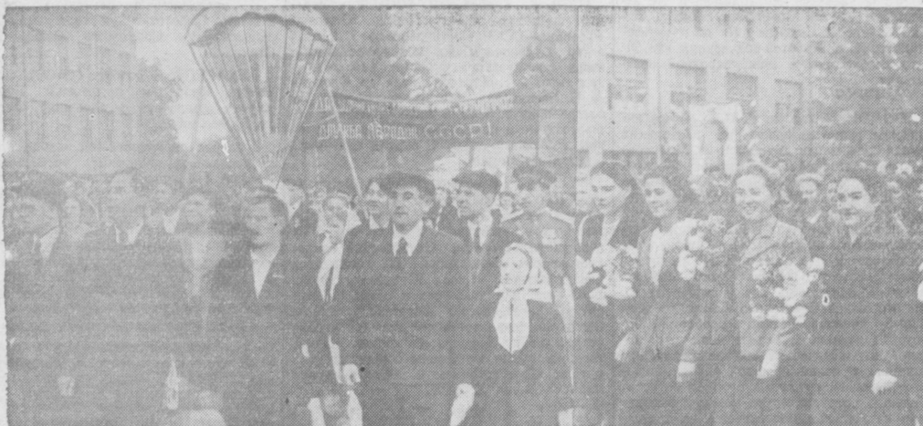
Трудящиеся г. Ташкента на Красной площади в день 28-й годовщины Великой Октябрьской социалистической революции.