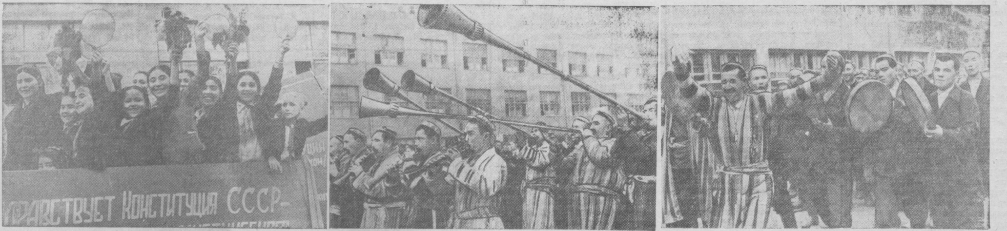
Трудящиеся г. Ташкента на Красной площади в день 28-й годовщины Великой Октябрьской социалистической революции.

В течение трех часов продолжалась праздничное шествие трудящихся столицы. Демонстрация, в которой приняло участие свыше полутора миллионов москвичей, показала сплоченность нашего народа вокруг партии Ленина — Сталина, его горячий советский патриотизм, его готовность к решению новых великих задач, вставших перед нашим государством в послевоенный период. (ТАСС).