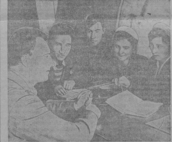
Ассистент кафедры основ марксизма-ленинизма Ташкентского финансово-экономического института тов. А. И. Кравченко консультирует студентов по основам марксизма-ленинизма.