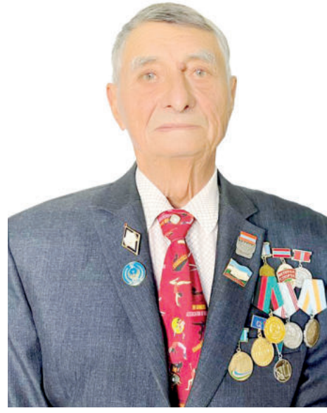
НАСТАВНИК ЗАСЛУЖЕННЫХ ТРЕНЕРОВ