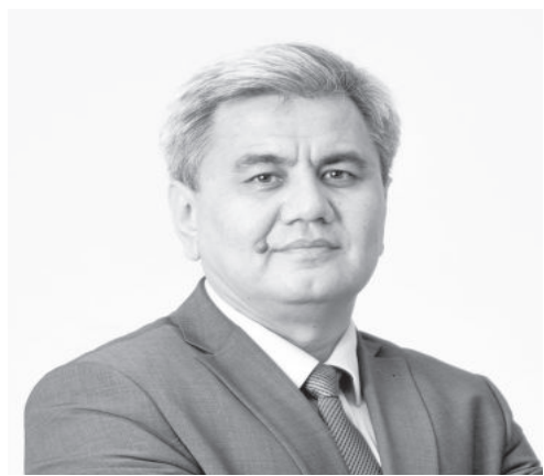
Обид Хакимов. Директор Центра экономических исследований и реформ при Администрации Президента Республики Узбекистан.