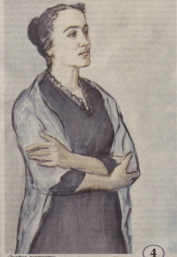
«Зулфия портрети». Музаавир Чингиз Аҳмадов.

1 Март — Ўзбекистон халқ шоири Зулфия тўғридаги кун