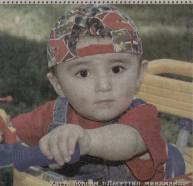
Мана бу ўғил «Ласетти» минаман...

ТДШИ қошидаги Олмазор академик лицейи ҳудудда жойлашган буфет учун ички танлов эълон қилинади. Буюртмачи — ТДШИ қошидаги Олмазор академик лицейи. Ички танлов комиссияси — ТДШИ қошидаги Олмазор академик лицейи. Манзил: Тошкент шаҳри, Олмазор тумани, Янги Олмазор кўчаси, 20-уй. Тел: 248-07-34