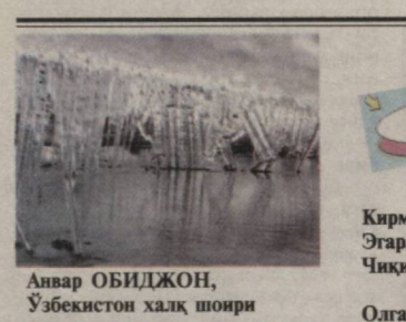
Анвар ОБИДЖОН, Ўзбекистон халқ шoirи

— Яхши томони шунки — эру хотинларнинг уриши даҳанаки. Яъни, бир-бирини ёқавайрон қилмайди, эри мушт кўтармайди, аёли ўқов ўқталмайди. Қалқай ҳақоратлаб сўкмайди, Балдай ер муштлаб қарғайди.