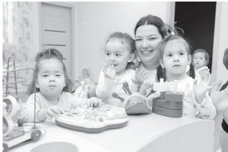
«Окончание. Начало на 1-й стр.»

В настоящее время в Узбекистане функционирует чуть более 28 тысяч ДОО (в 2017 году показатель составлял 5211). Благодаря вовлечению в сферу предпринимателей 33,8 процента детей посещают негосударственные образовательные организации. Примечательно тот факт, что на создание ДОО в рамках ГЧП направлены льготные кредитные средства в размере 2,2 трлн сумов. Посредством осуществления строительно-ремонтных работ на 1424 объекта (199 - в 2021-м) за счет инвестиционных программ в период с 2018-го по 2021 год дополнительно создано более 73 тысяч мест (12 395 - в 2021-м).