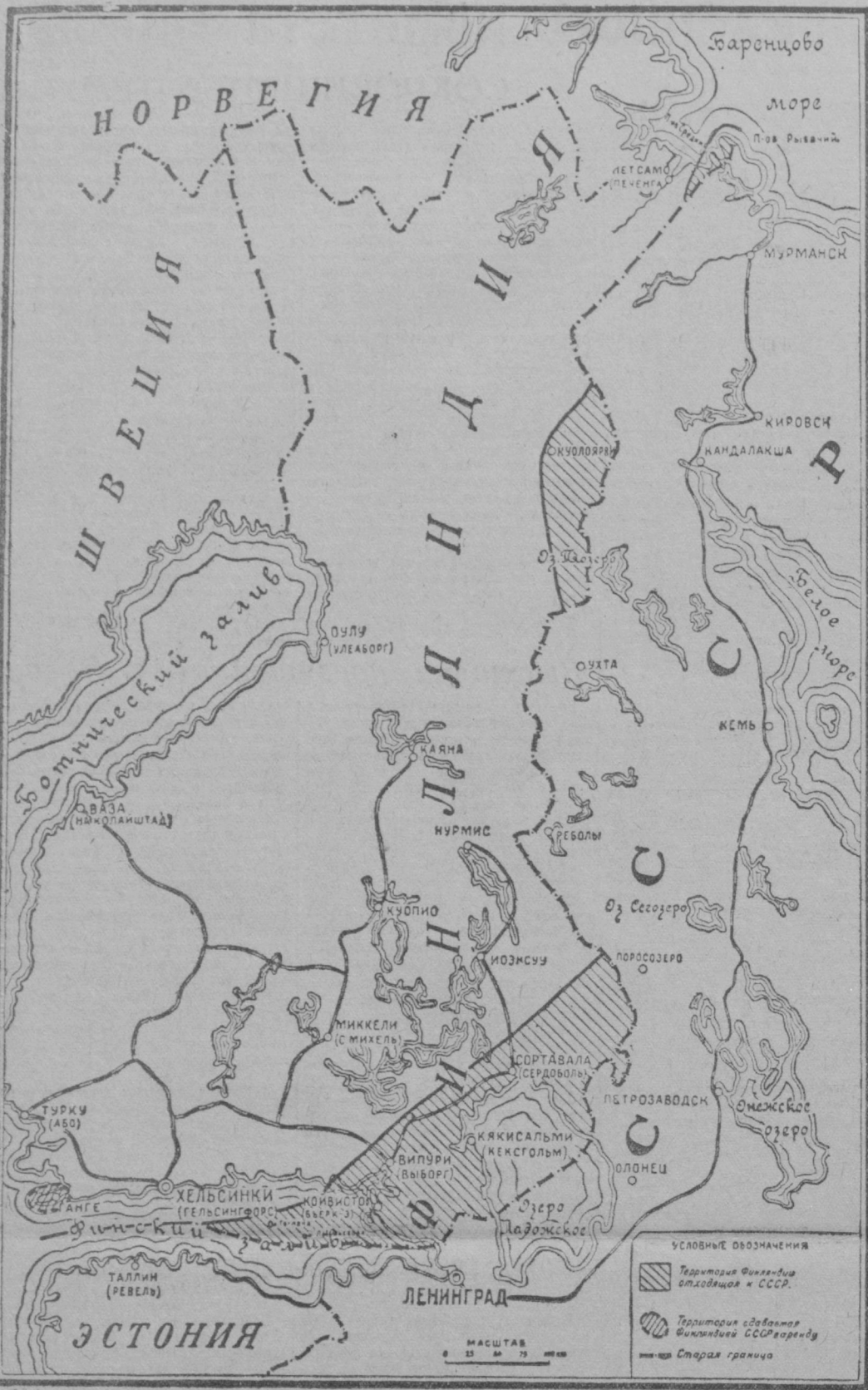
Карта, приложенная к мирному договору между СССР и Финляндской республикой. («Правда» за 13 марта).