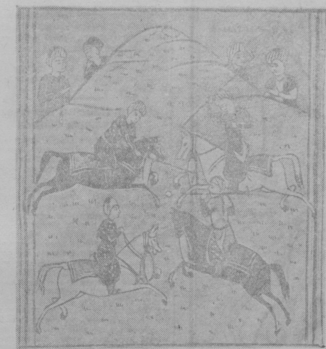
Иллюстрация неизвестного художника на рукописи произведения А. Навои «Гариб-аль-сегаар», приобретенной недавно Республиканским юбилейным комитетом. Рисунок изображает игру в шашки на лошадях, известную сейчас под названием «шоло». (Публикуется впервые).

По поводу жестоких наказаний он писал: «Цветущие земли разрушает он, шедо до голубой совам уступает он; кровопролитие — ремесло его, каждому жезу-щему омертвю угрожает он».