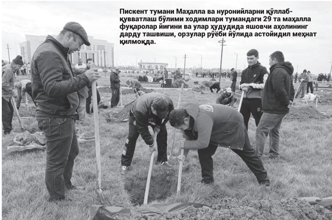
Пискент тумани Маҳалла ва нуронийларни қўллаб-қувватлаш бўлими ходимлари тумандаги 29 та маҳалла фуқаролар йиғини ва улар ҳудудида яшовчи аҳолининг дарду ташвиши, орзулар рўёби йўлида астойдил меҳнат қилмоқда.

Фуқаролар йиғинларининг моддий-техника базасини мустаҳкамлаш мақсадида 420 млн. сўмлик ҳомийлар маблағлари ҳисобидан замонавий компьютер жамланмалари ҳамда мебеллар тўплами олиб берилди. Барча маҳалла бинолари интернет тармоғига уланган.