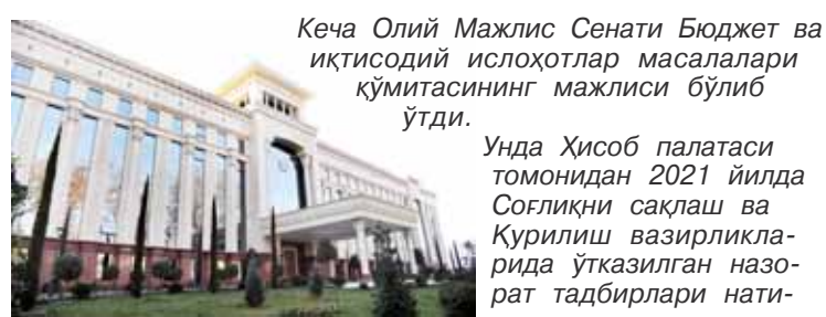
Кеча Олий Мажлис Сенати Бюджет ва иқтисодий ислохотлар масалалари қўмитасининг мажлиси бўлиб ўтди.

Унда Ҳисоб палатаси томонидан 2021 йилда Соғлиқни сақлаш ва Қурилиш вазирликларидан ўтказилган назорат тадбирлари натижасида аниқланган кам-чилик ва қонунбузилишларни бартараф этиш ҳолати юзасидан мазкур вазирликлар раҳбарларининг ахборотлари эшитилди.