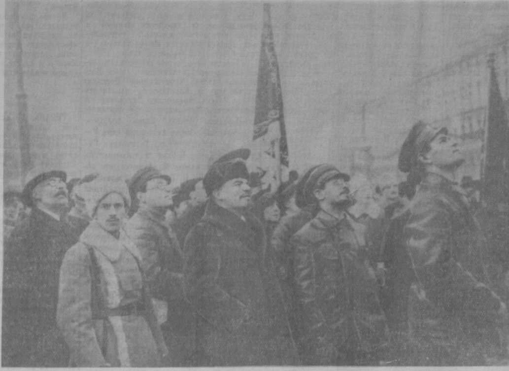
В. И. Ленин и Я. М. Свердлов на площади Революции в Москве 7 ноября 1918 года. Экспозиция Центрального музея В. И. Ленина.