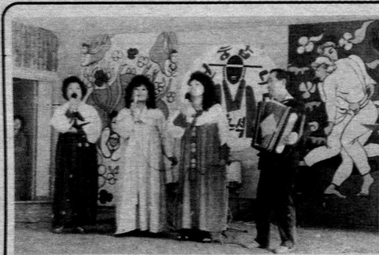
Узбекистан — наш общий дом

Уже стало доброй традицией каждое воскресенье проводить в парке имени Улугбека массовые гулянья. Вот и в минувшее воскресенье здесь прошел праздник интернациональной дружбы. Активное участие в нем приняли казахский, русский, корейский, уйгурский культурные центры. Их представители познакомили отдыхающих с обычаями и обрядами своих народов. С особым теплом присутствующие принимали выступления фольклорных ансамблей. Хозяева праздника — представители искусства и культуры Узбекистана познакомили гостей парка с творчеством поэтов