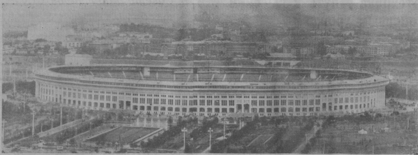
Москва. Центральный стадион в Лужниках. Большая спортивная арена.