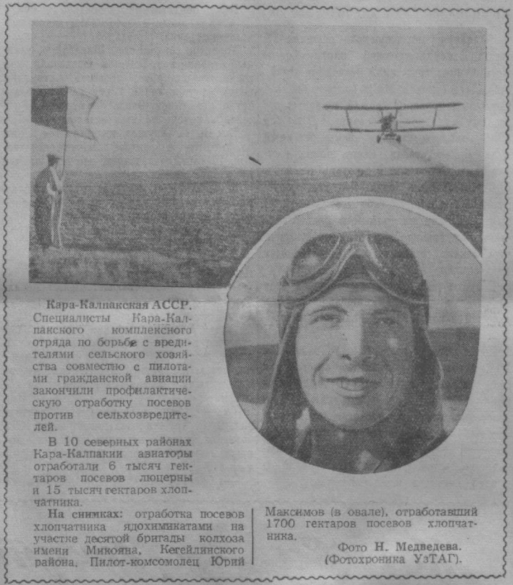
Кара-Калпакская АССР. Специалисты Кара-Калпакского комплексного отряда по борьбе с вредителями сельского хозяйства совместно с пилотами гражданской авиации закончили профилактическую обработку посевов против сельхозвредителей.