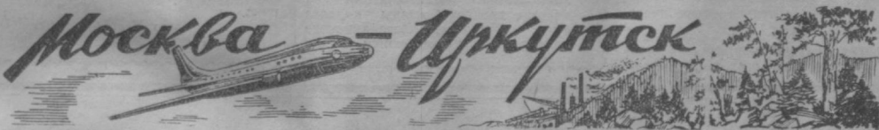
НА «ТУ-104» ПО ТРАНССИБИРСКОЙ ВОЗДУШНОЙ МАГИСТРАЛИ

Внуковский аэродром столицы, 5 часов 50 минут утра. У здания аэровокзала, как взрослый человек среди подростков, стоит огромный серебристый самолет «ТУ-104». Он отправляется в далекий рейс — в Иркутск, навстречу солнцу. Закончены последние приготовления. Закрыты двери герметизированной кабины. Загудел турбостартер, а за ним — основная двигатель. Легко развернувшись, самолет пошел к старту. Еще несколько минут, и под нами Москва.