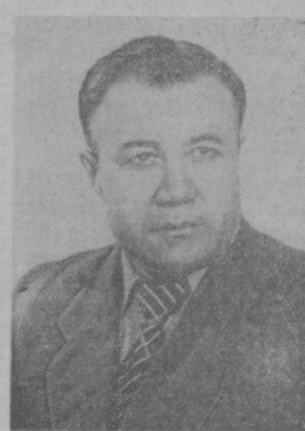
Х. Ф. ФАЗЫЛОВ Академик-секретарь Академии наук Узбекской ССР