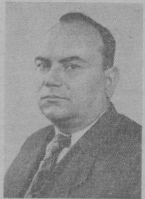
С. В. СТАРОДУБЦЕВ Первый вице-президент Академии наук Узбекской ССР