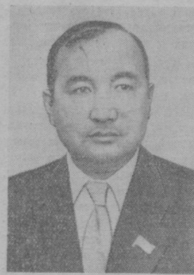
Х. М. АБДУЛЛАЕВ Президент Академии наук Узбекской ССР