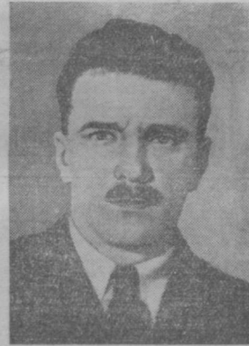
С. П. ТОЛСТОВ