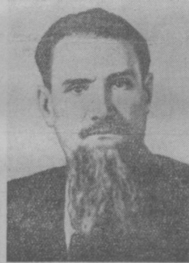
И. В. КУРЧАТОВ