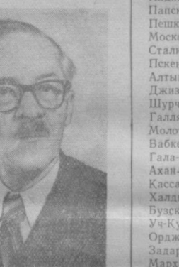
В. В. ЯХОНТОВ