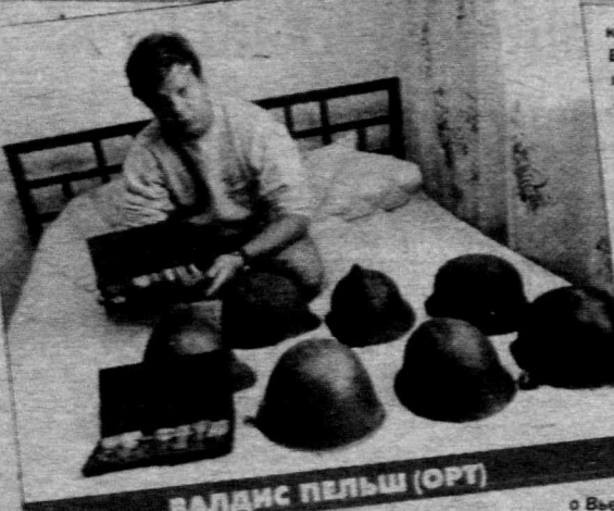
ВАЛДИС ПЕЛЬШ (ОРТ)

Вниманию победителей лотереи «Подписка-95!» Напоминаем: выдача призов продлится до 30 декабря с. г. (результаты розыгрыша были опубликованы в № 84 от 25 октября с. г.). Поспешите за выигрышами!