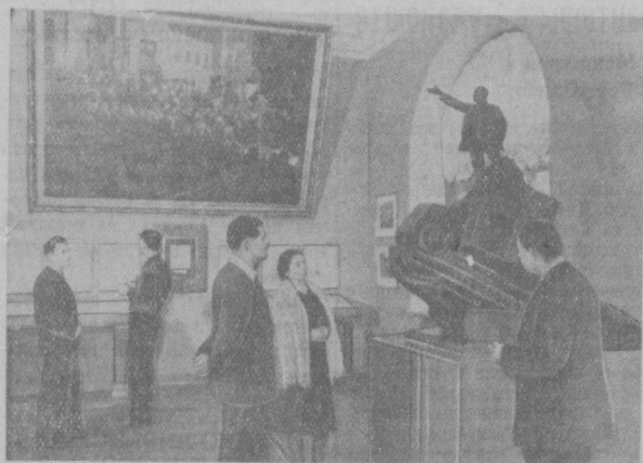
Москва. Центральный музей В. И. Ленина. Зал «Ленин в Октябре». На снимке: посетители у скульптуры М. Манизера «В. И. Ленин на броневике».