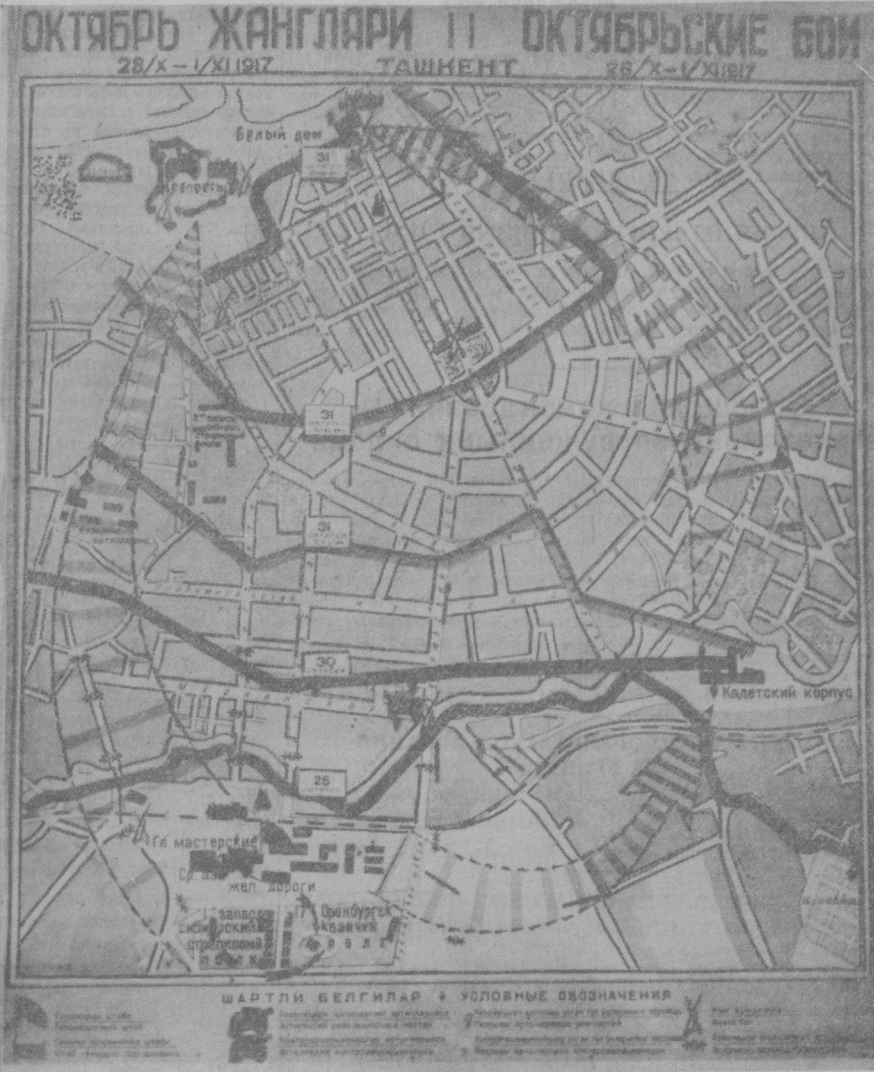
Октябрьские бои в Ташкенте. Карта Ташкента, на которой обозначен ход вооруженного восстания. Слева внизу: главные мастерские Среднеазиатской железной дороги и расположение 1-го Сибирского запасного стрелкового полка. Слева в середине: казармы артиллерии, в верхнем левом углу — военная крепость. Стрелки указывают направление основных ударов восставших рабочих и солдат, линии с датами — движение красновардейских частей.