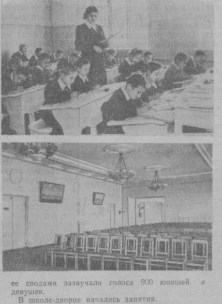
На снимках: сверху — внешний вид школы; посередине — первый урок во втором классе «б»; внизу — актовый зал школы.

Новая школа — прекрасный подарок для учащихся Ташкента. Это самое красивое школьное здание в Узбекистане. Его строительство было начато в марте этого года, и вот уже вчера под