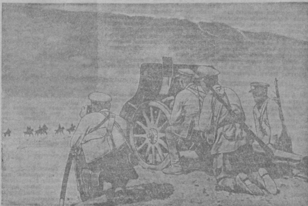
УЧЕНИЯ ЧАСТЕЙ САВО. На снимке: Артиллерия огнем поддерживает отход конницы.