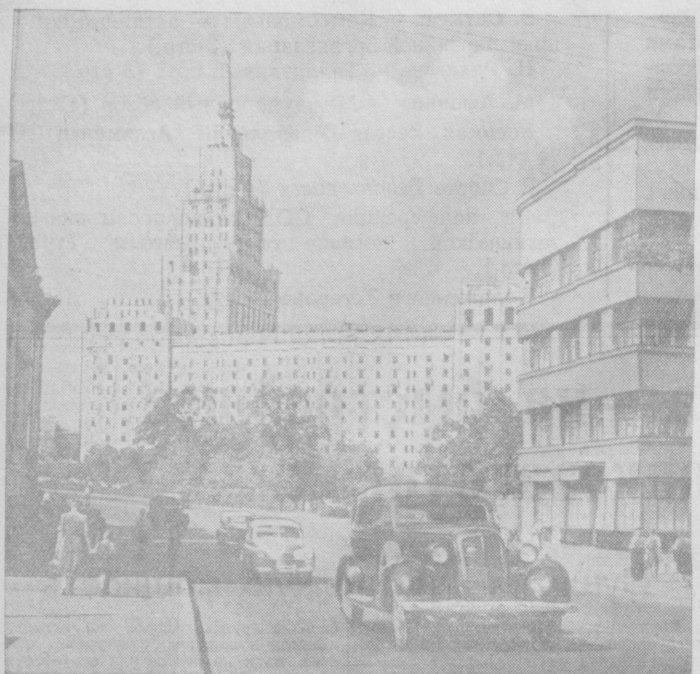
Москва. Вид на высотное здание Министерства путей сообщения со стороны Ново-Басманной улицы.

Актуальность совещания Министров Иностранных Дел отнюдь не уменьшилась. Не следует, однако, поворачивать дело таким образом, чтобы заранее сводить совещание к обсуждению одной какой-либо проблемы и исключать из поля зрения такого совещания основной вопрос — вопрос о смягчении напряженности в международных отношениях. Любый успех на этом пути, будет ли он касаться Запада или Востока, может рассматриваться как достижение миролюбивых стран.