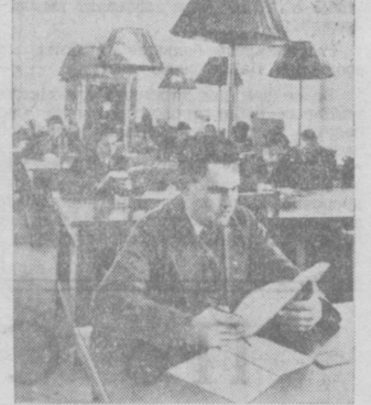
На снимке: в читальном зале Публичной библиотеки им. Навои.

Замечных успехов добились и наши художники. В каждой новой картине наши мастера кисти стремятся ярче и убедительнее показать советскую действительность, советского человека — героя нашего времени.