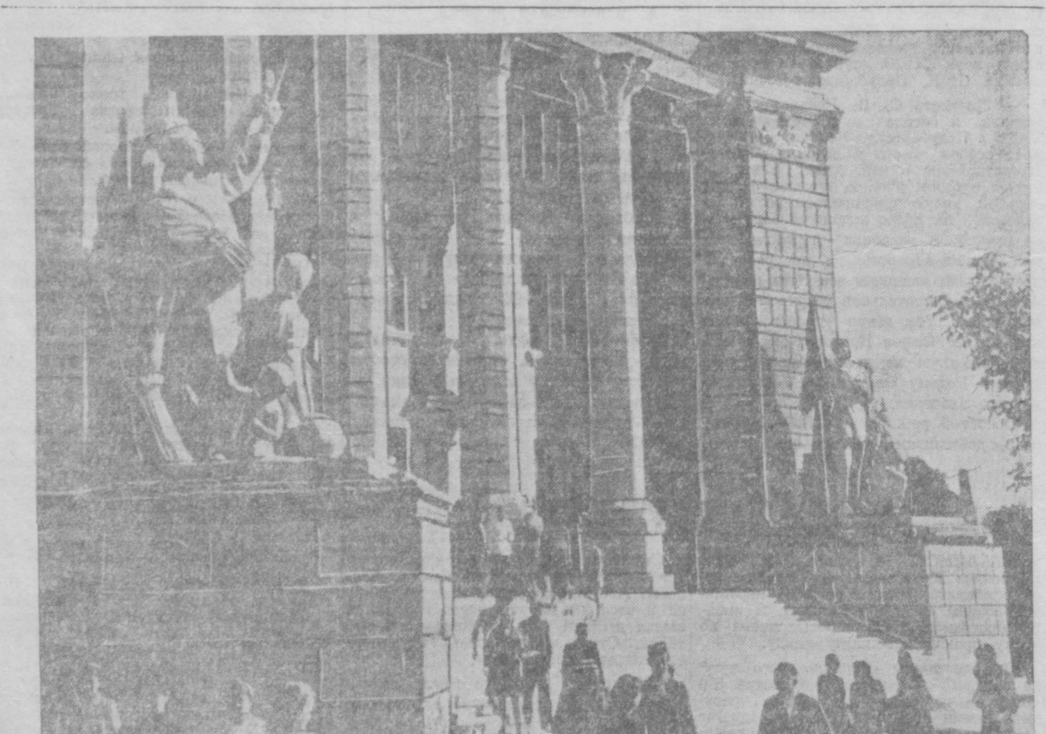
На снимке: у входа в здание Педагогического института им. Низами в г. Ташкенте.