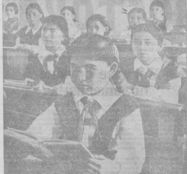
В таинственной средней школе № 38. На снимке: на уроке математики в четвертом классе.