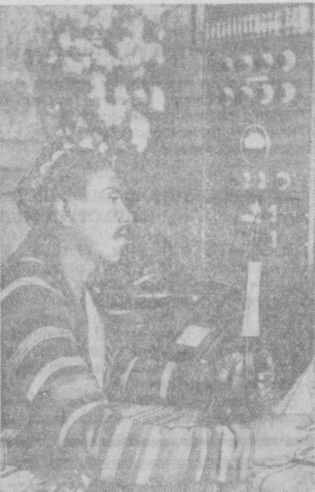
На снимке: в студии радиоузла колхоза им. Дзержинского, Андриановского района.

Теперь в Узбекистане имеется 650 библиотек, 2500 клубных учреждений, сеть краеведческих и искусствоведческих музеев.