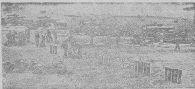
ВОЙНА МЕЖДУ АНГЛИЕЙ И ГЕРМАНИЕЙ. На снимке: артиллерийские укрепления на южном побережье Англии.

В Италии, заявил Муссолини, находится под ружьем миллион человек; в случае необходимости Италия может призвать еще 8 миллионов.