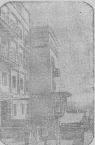
Одни из новых жилых домов в гор. Чирчике.