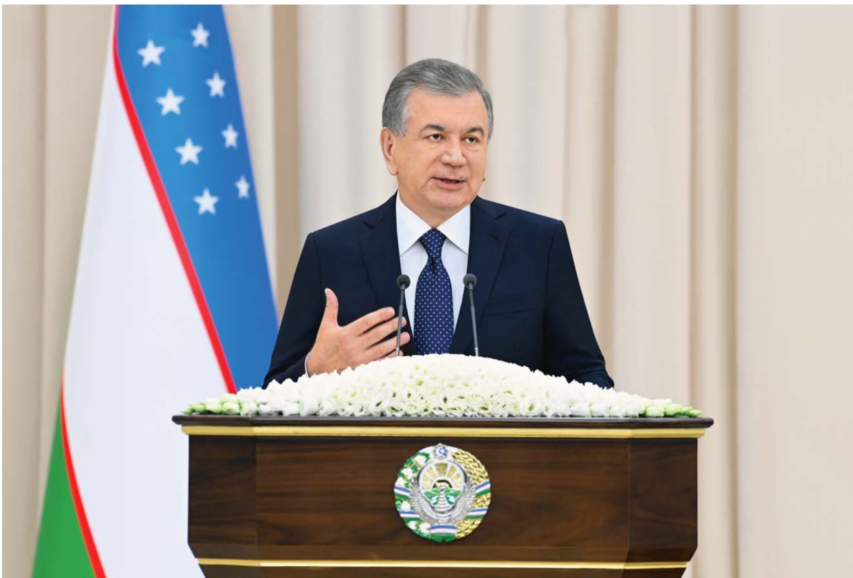
Президенти Ҷумҳурии Ӯзбекистон Шавкат Мирзиёев 25 ноябр аз вилояти Навой боздид ба амал овард.

Дар доираи сафар роҳбари давлат дар ҷамъомади ғайринавбатии Шӯрои вилояти депутатҳои халқ иштирок намуд.