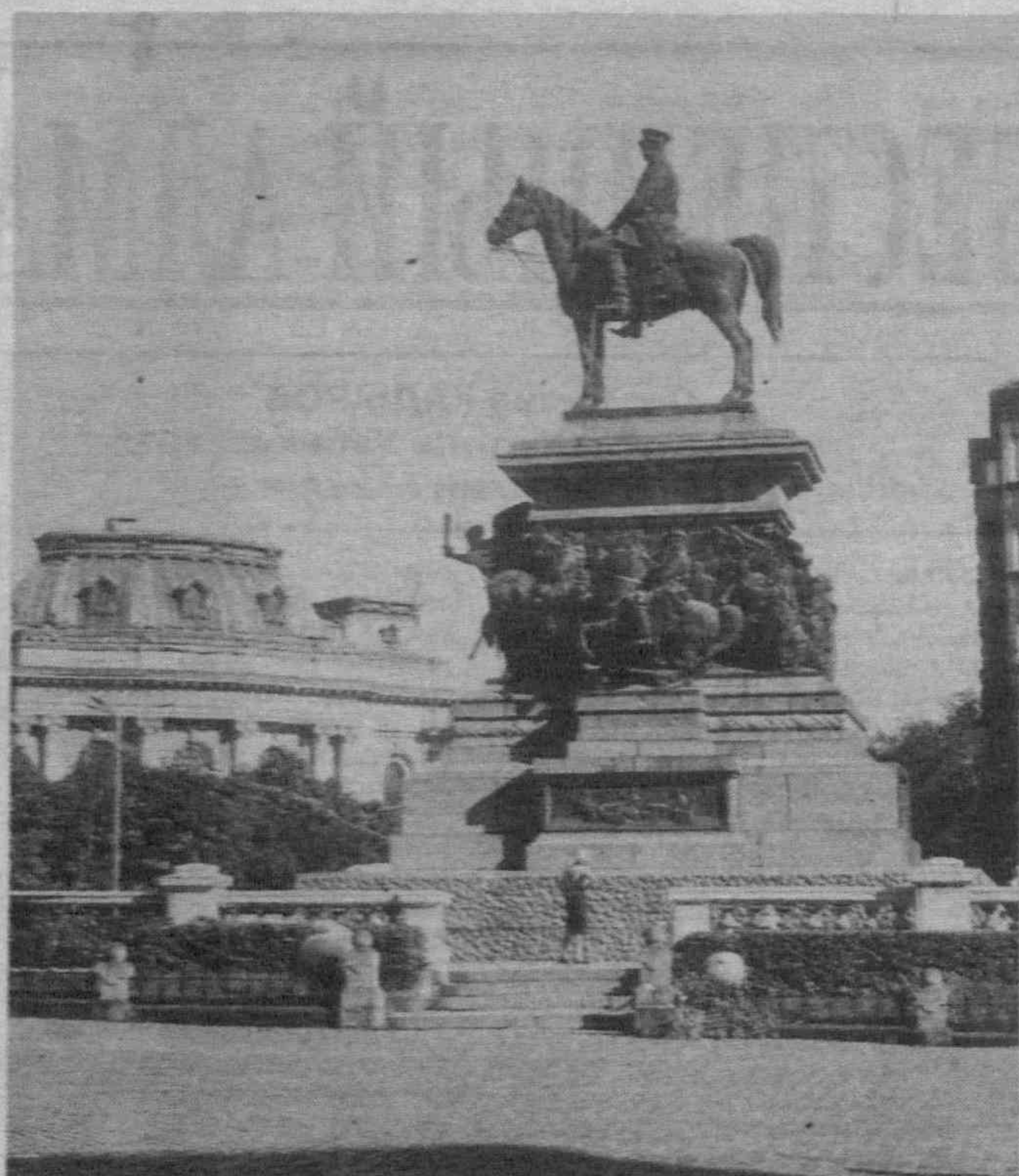
София. Площадь «Народное собрание».

Имеется комплекс телерадиостудий «Мубарак» из 14 студий для оказания услуг в производстве кино- и телепродукции для всех арабских государств.