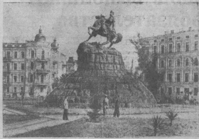
Киев. Памятник Богдану Хмельницкому.