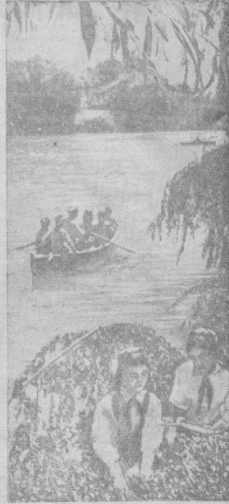
На Комсомольском озере.

Готовят кандидатские диссертации геологи тт. Г. М. Аладатов, А. А. Хлобистов, А. А. Воробьев и другие.