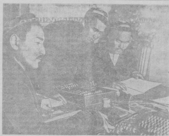
Колхоз им. Кавановича, Инги-Юльское района, получил в этом году миллионы доходов...