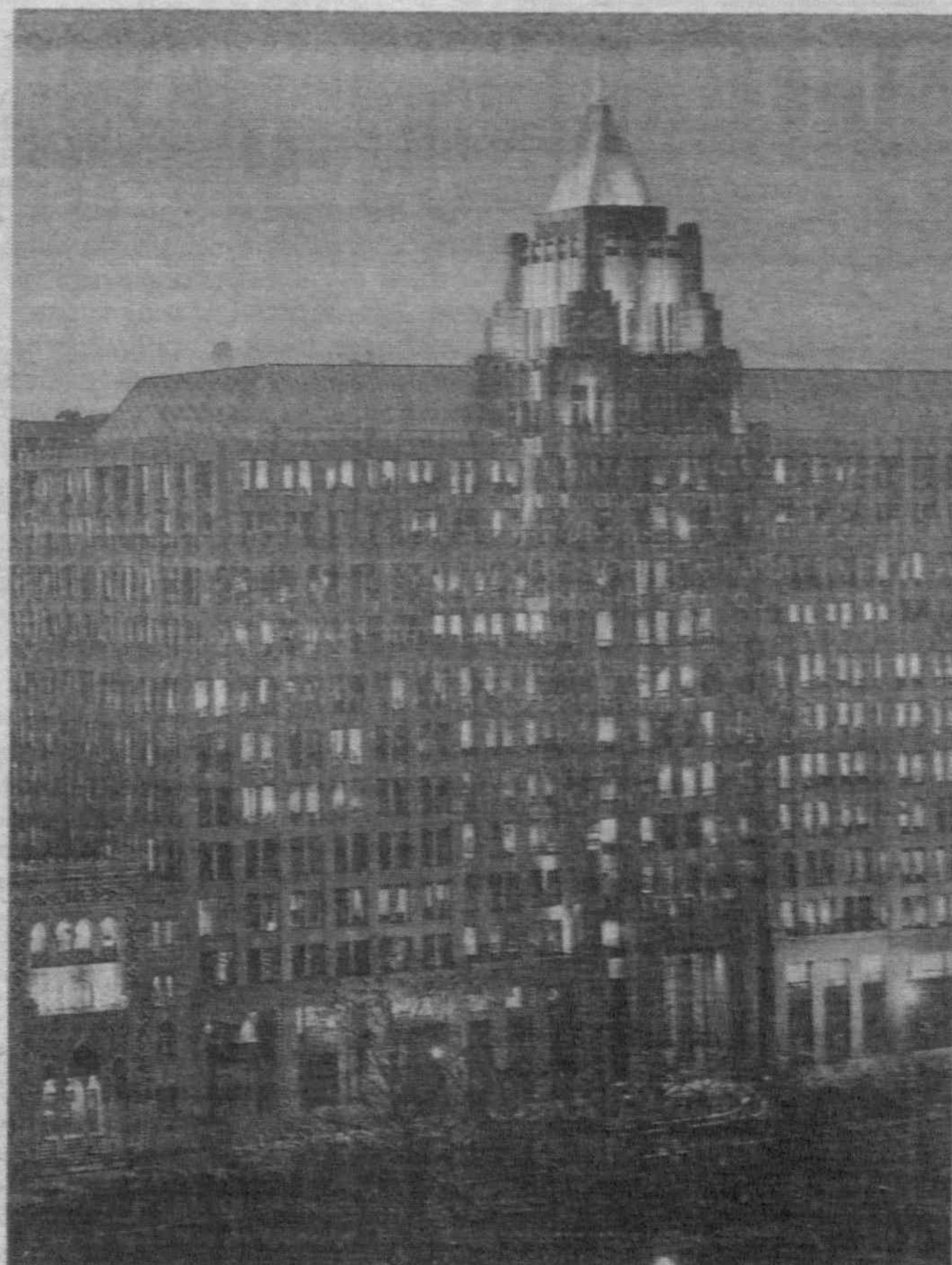
ПО ГОРОДАМ МИРА. Деловые здания в центре Вашингтона.

Парламент Турции на очередные четыре месяца, начиная с 30 ноября, продлил срок действия режима чрезвычайного положения на юго-востоке страны. Режим ЧП действует с 1987 года. За годы противостояния с курдами там погибло более 21 тысячи человек.