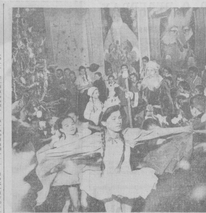
Радостью, счастьем светятся лица детворы. Звучат задорные песни, кружится веселый хором мальчишек и девчонок вокруг традиционной новогодней елки во Дворце пионеров имени В. И. Ленина.