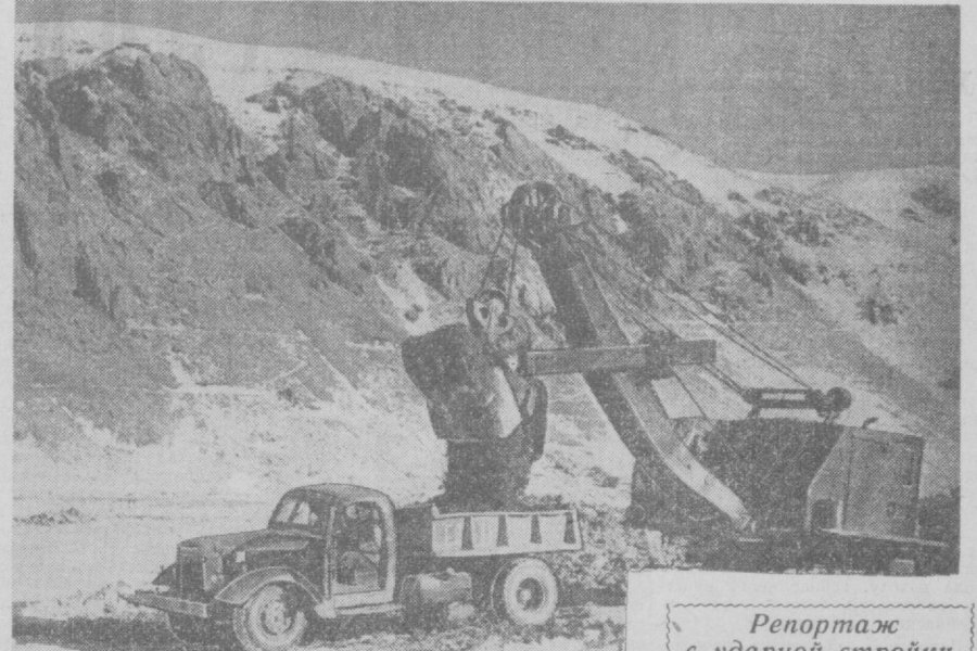
Репортаж с ударной стройки