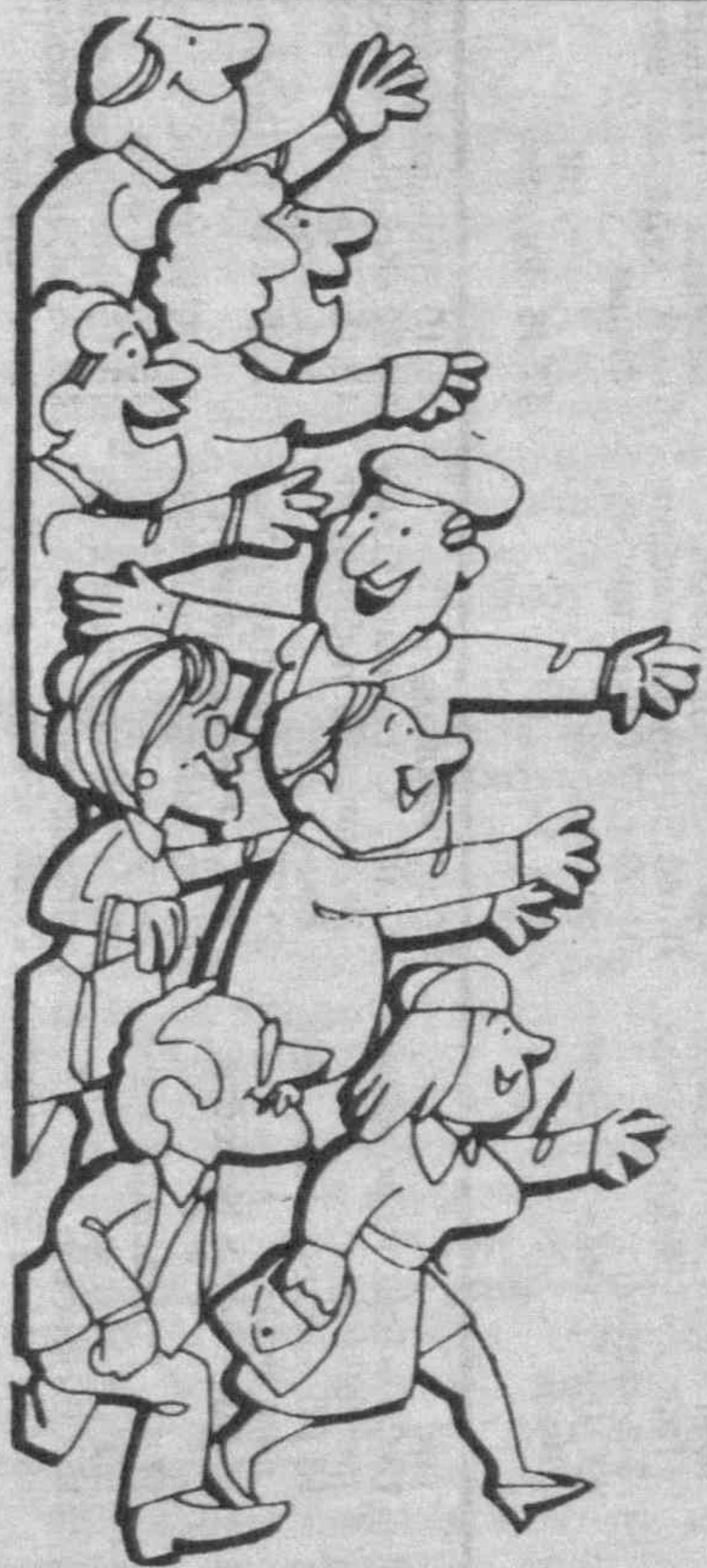
Ряд приватизационных инвестиционных фондов уже начал борьбу за своих потенциальных акционеров, иначе говоря, за нас с вами, рекламируя свои возможности через средства массовой информации.