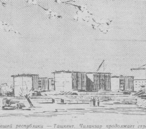
Столица нашей республики — Ташкент. Чиланзар продолжает строиться!

Главный цех птицефабрики — инкубаторий — был построен с опоз-