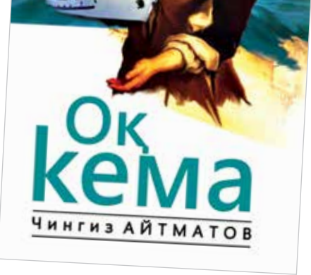
маданияти ва маънавиятини энг гўзал ва бетакор тарзда ифодалаб берган ўлмас асарлардир.