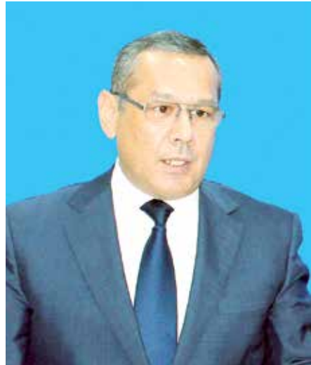
Улуғбек ИНОЯТОВ, Олий Мажлис Қонунчилик палатаси Спикери ўринбосари