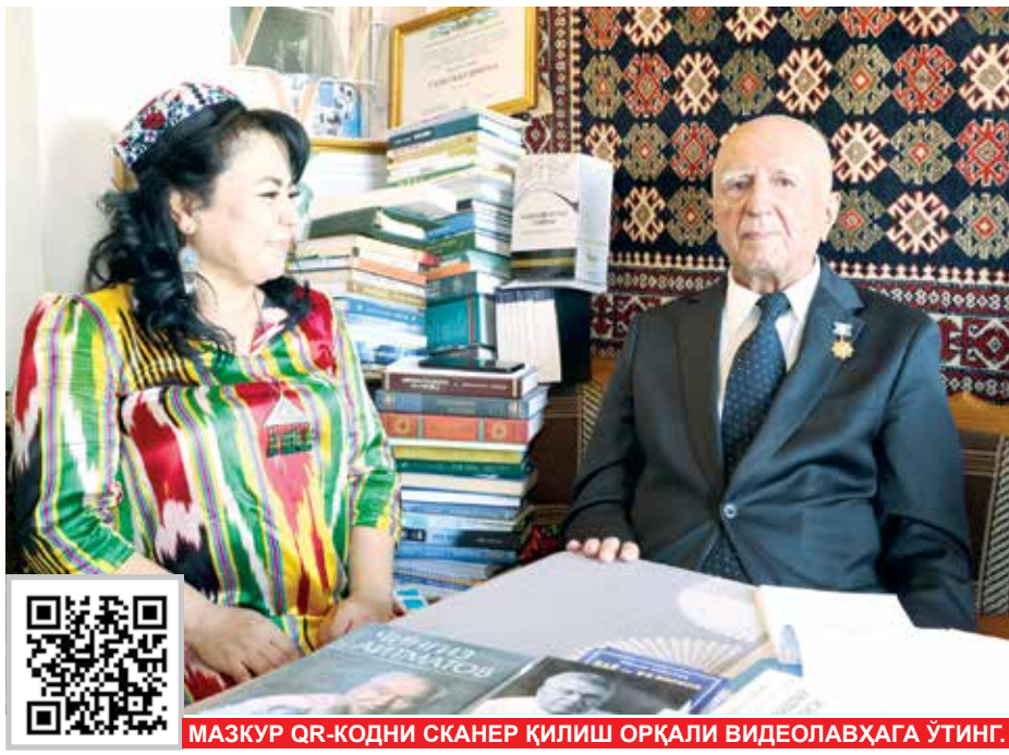
МАЗКУР QR-КОДИНИ СКАНЕР ҚИЛИШ ОРҚАЛИ ВИДЕОЛАВҲАГА ЎТИНГ.