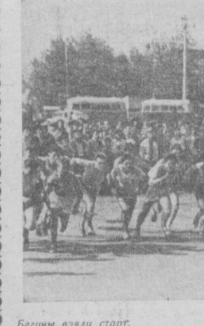
Бегуны взяли старт.