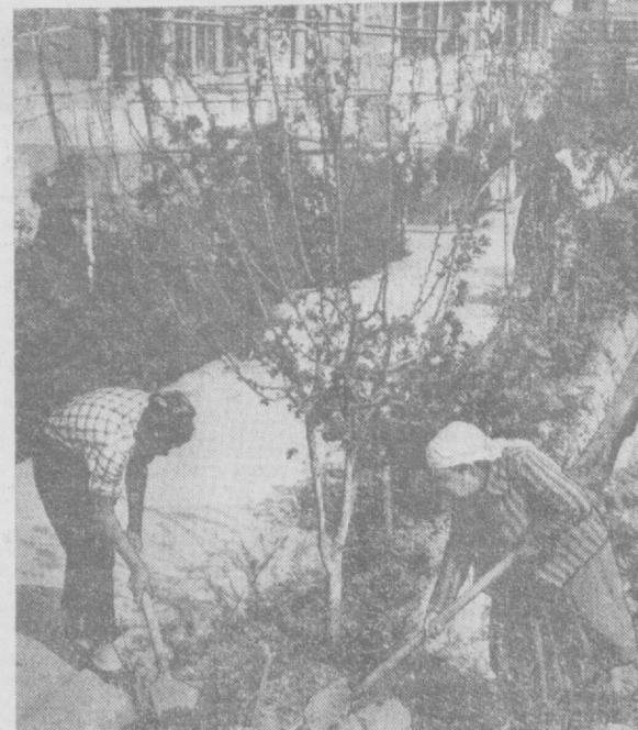
Немало на Чиланзарском жилищном массиве в Ташкенте образцов зеленых насаждений. Благообразят их стараниями владельцев домов, посадивших много зеленых утолков. На этом снимке заснята группа жителей дома № 71, ухаживающих за посадками цветов и молодых деревьев.

Сотни школьников Ташкентской, Самаркандской и Сурхандарьинской областей в дни весенних каникул совершили экскурсии в Самарканд. Они посетили памятники старины, в том числе обязательную Улугбеку, побывали в Музее культуры и искусства Узбекиской ССР. И. СИДОРЕНКО.