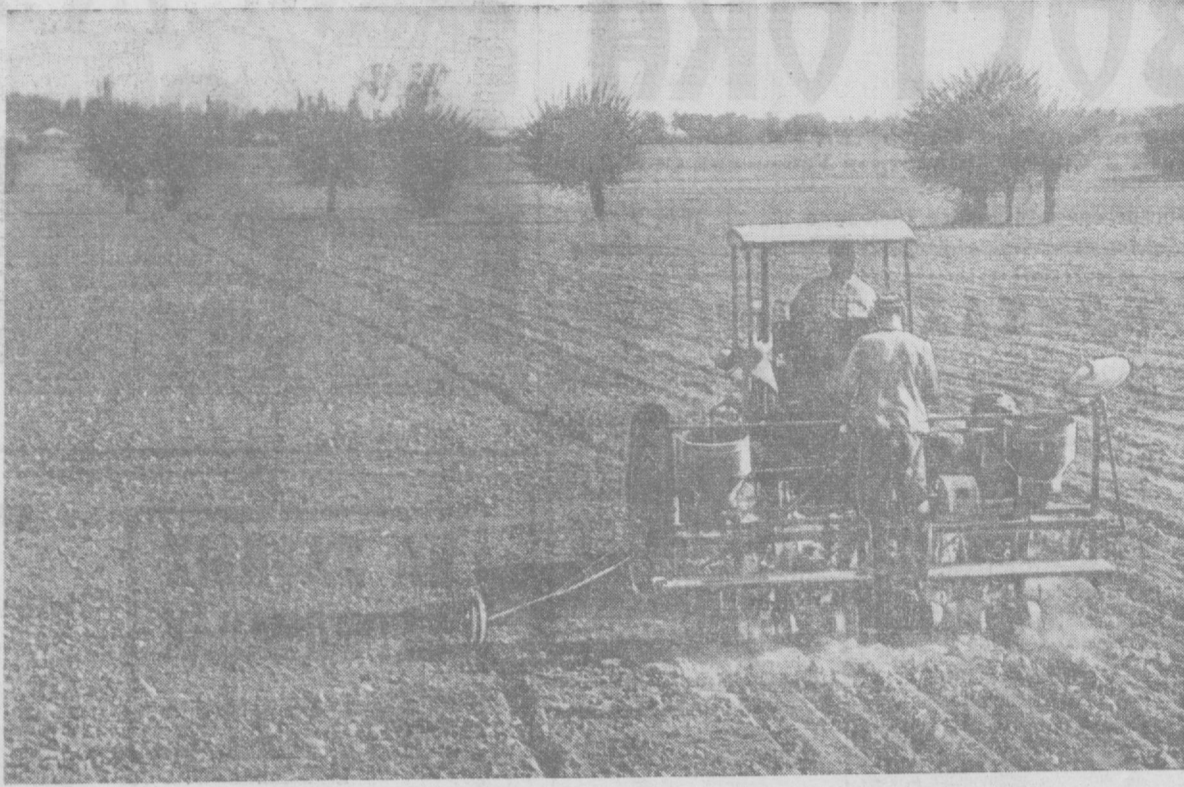
Высокими темпами идет сев хлопчатника в крупнейшей высокоурожайной колхозе «Камл Узбекистан» Калининского производственного управления. Хлопкоробы взяли обязательство провести сев в сжатые сроки и получить стопроцентные всходы растений. На снимке: сев хлопчатника в передовой девятой бригаде.

Боевая задача состоит в том, чтобы энергия всех тружеников села была направлена в эти дни против косности и консерватизма, чтобы технический прогресс получал свое дальнейшее развитие. Все внимание должно быть приковано к квадратам!