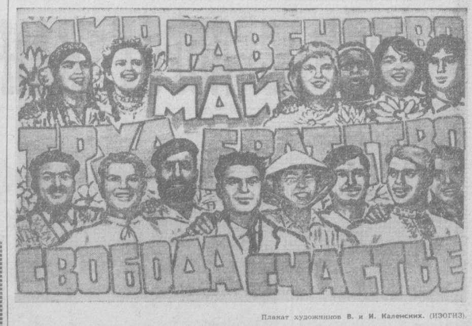
Плакаты художников В. и И. Каленских. (ИЗОГИЗ)

Участники актива одобрили деятельность Киргизсовпрофа за отчетный период.