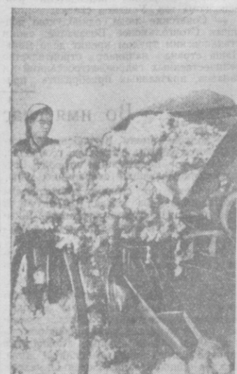
На полях колхоза «Айдын», Чиназского района. На снимке: очистка хлопка ворохоочистителем.

К машинной уборке хлопка приступили также в колхозах Кегейлинского и Чимбаленского районов.