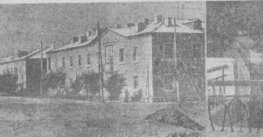
1. В Голодной степи вырос город Якшер. Ныне он — центр новой Сырдарьинской области. 2. Большой Ферганский канал является творческим вкладом узбекского народа в выполнение программы ирригационного строительства. 3. Вот оно, живое воплощение скупых слов из ленинского декрета: «по устройству водохранилищ в верховьях рек», Чалджурганское море.

Илет могучее наступление на веками пустовавшие земли, героическая борьба за большой хлопок. Волею партии и народа мечты великого Ленина претворяются в жизнь!