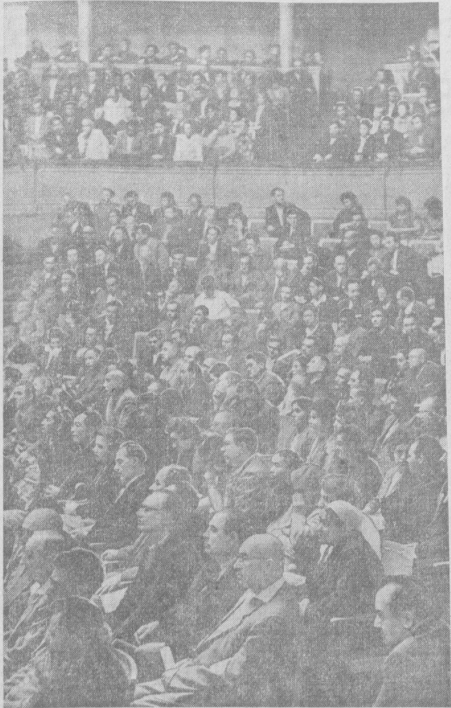
В зале собрания партийно-хозяйственного актива работников промышленности Среднеазиатского экономического района.

У строителей Керкидонского водохранилища наступил большой праздник: началось заполнение котлована ирригационного гиганта Ферганской долины. В течение нынешнего лета чаша искусственного водоема примет первые двадцать миллионов кубометров живительной влаги. Новый бассейн плодородия, как называют хлопкоробы Керкидонское водохранилище, сооружается на границе двух братских республик — Узбекистана и Киргизии. Его общая емкость — двести десять миллионов кубометров. В этом году первая очередь искусственного моря войдет в эксплуатацию. Полное окончание строительства керкидонской копилки влаги позволит улучшить водобеспеченность почти пятидесяти тысяч гектаров хлопковых плантаций.