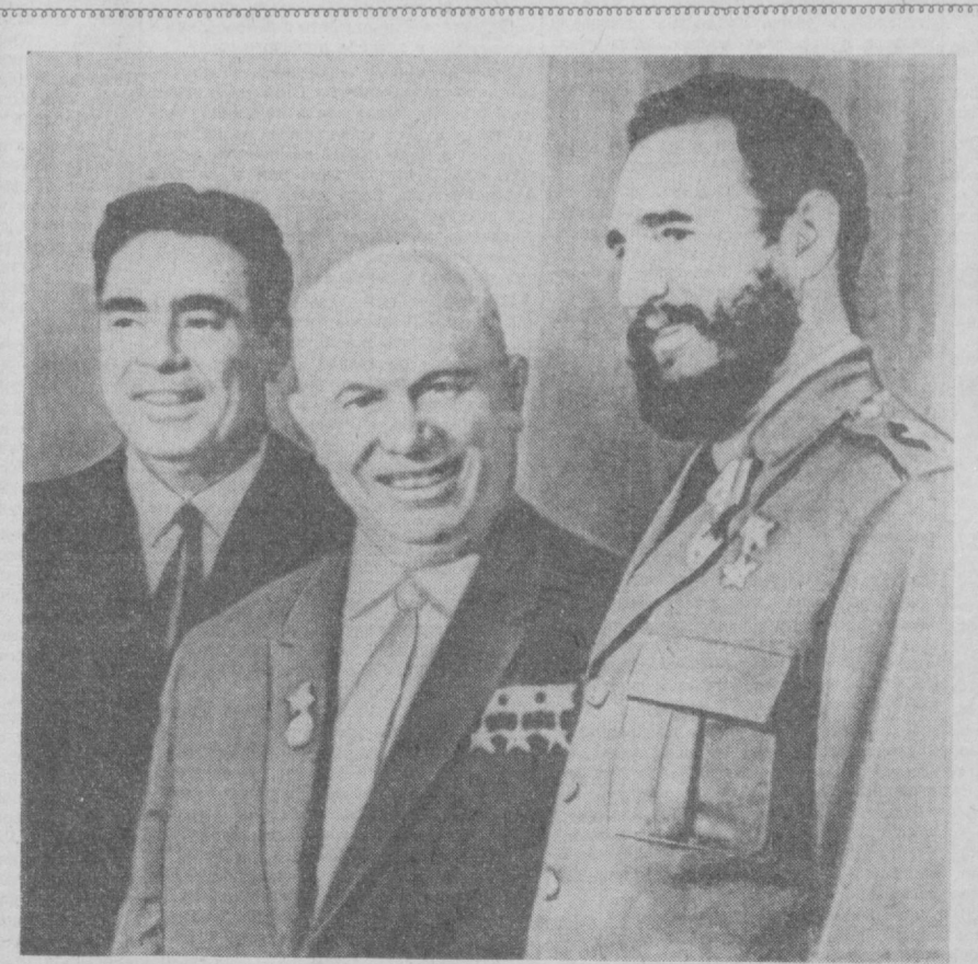
Москва, 23 мая 1963 года. Прием в честь Фиделя Кастро в Кремле. НА СНИМКЕ: товарищи Н. С. ХРУЩЕВ, ФИДЕЛЬ КАСТРО и Л. И. БРЕЖНЕВ после вручения дорогому гостю высокой награды.