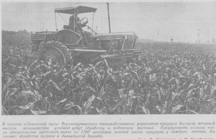
В колхозе «Ленинский путь» Верхнехирчирского производственного управления кукуруза достигла метровой высоты, механизаторы успешно ведут обработку и подкормку растений. Кукурузоводы колхоза взяли обязательство заготовить не менее 1500 центнеров зеленой массы кукурузы с каждого гектара. На снимке: обработка посевов в двенадцатой бригаде.

«Мы много слышали о гостеприимстве вашего народа, но сердечности и теплоты приема, оказанного нам в Советском Союзе, превзошли все наши ожидания».