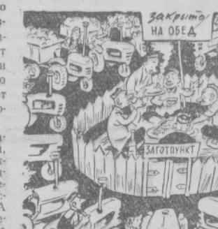
Рис. М. Воробейникова.

димо срочно просунуть. Иначе произойдет самозагорание.