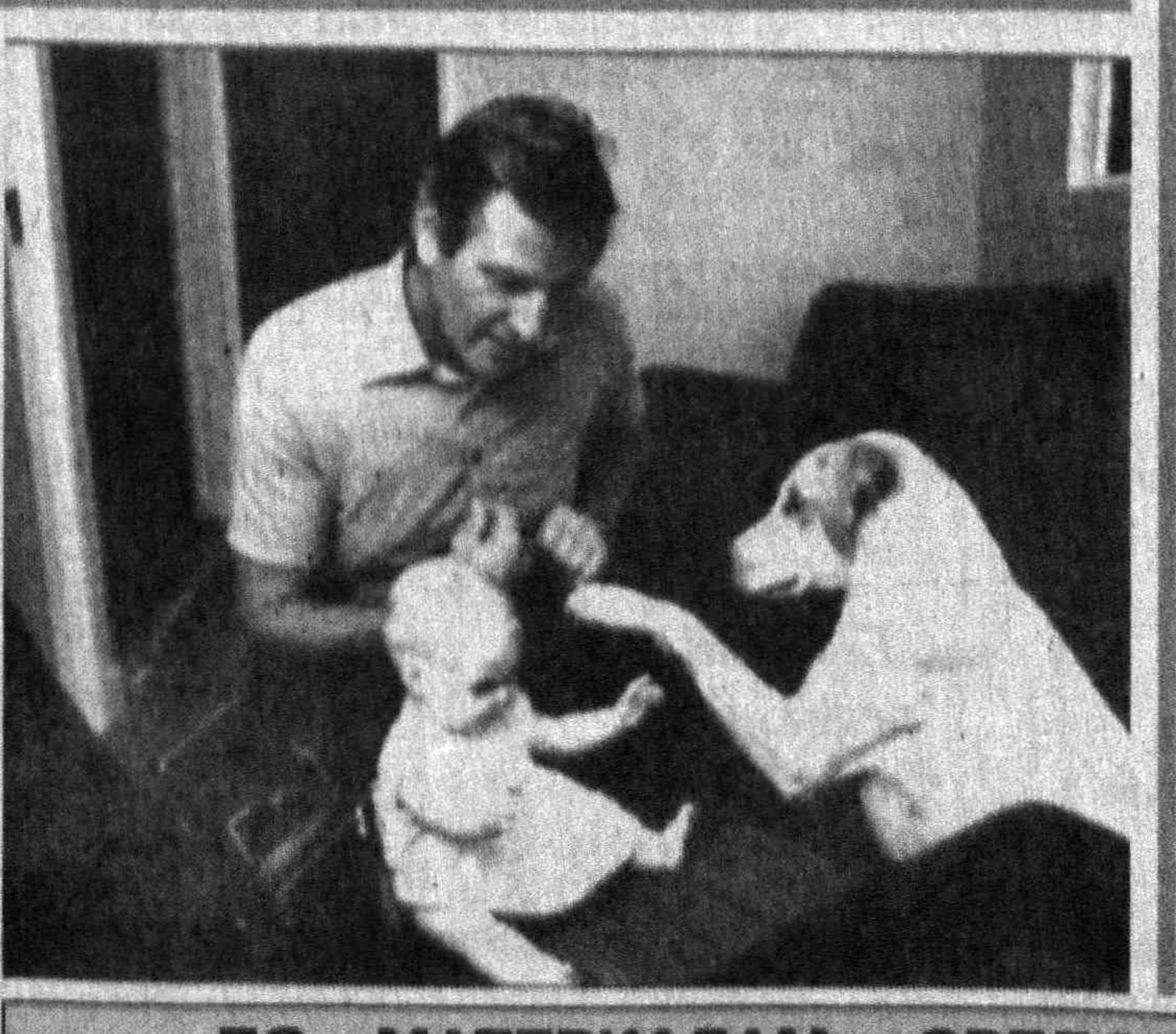
ПО МАТЕРИАЛАМ СРЕДСТВ МАССОВОЙ ИНФОРМАЦИИ

Бланкетта, который еще в детстве лишился зрения и с тех пор передвигается с помощью собаки-поводыря. По мнению «Дейли телеграф», основной секрет лабрадоров - в покладистости характера. Хозяева признают, что эти псы - отличные друзья, хорошо ладят с другими собаками, с кошками и, конечно, с людьми.