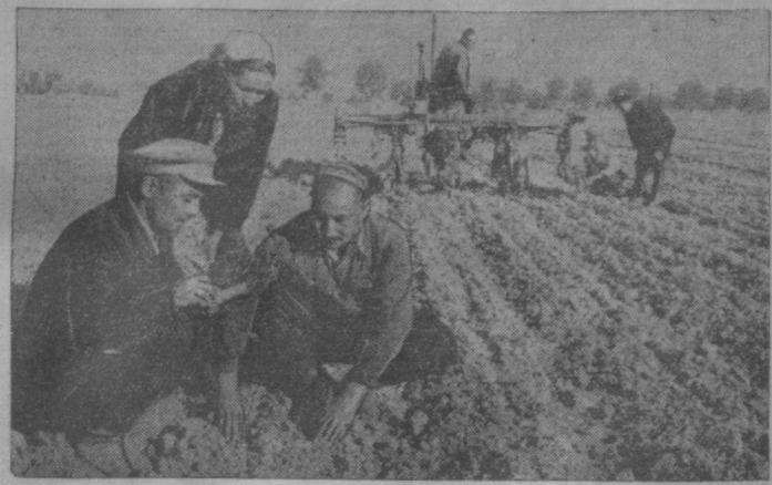
Ташкентская область. Члены сельхозартела имени Свердлова, Янги-Юльского района, борются за получение сорочкацентнерного урожая хлопка с гектара на 1000 гектаров площади. На полях колхоза появились дружные всходы, началась междурайонная обработка хлопчатника. На снимке: взаимопроверочная бригада Средне-Чирчинского района на полях колхоза имени Свердлова проверяет качество культивации хлопчатника.

Ручные прореживатели начали изготавливать также механизаторы 1-й Уч-Курганской и Нарынской МТС.