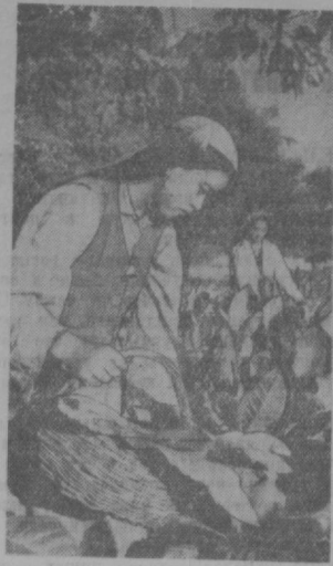
Самаркандская область. В колхозах Ургутского района началась ломка табачного листа нового урожая. На снимке: ломка табачного листа на полях колхоза имени Кирова.