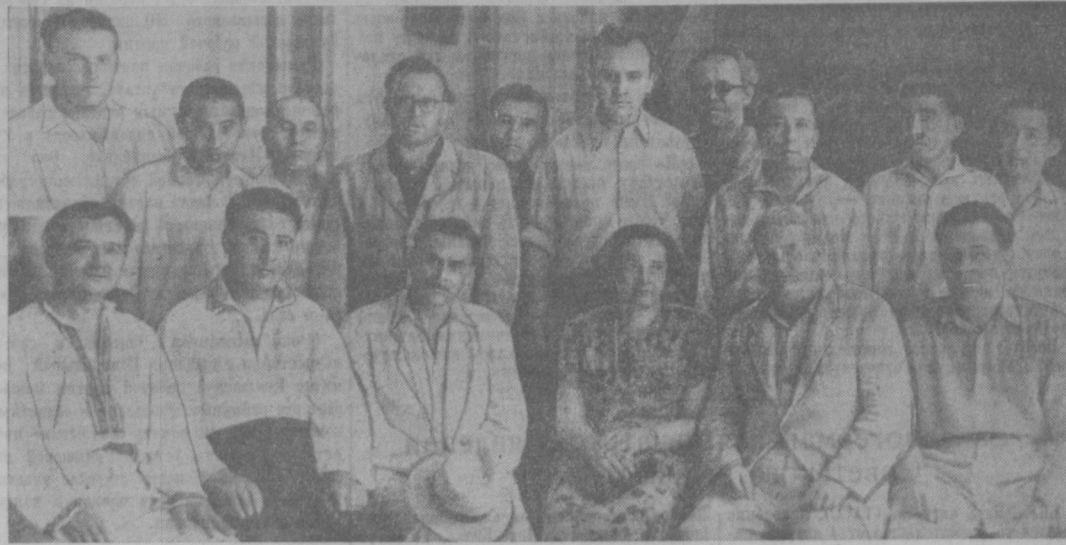
На снимке: группа делегатов и гостей III съезда советских писателей Узбекистана с руководителем делегации Союза советских писателей СССР Н. С. Тихоновым (второй справа в первом ряду) в Союзе писателей Узбекской ССР.