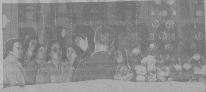
На Всесоюзной сельскохозяйственной выставке