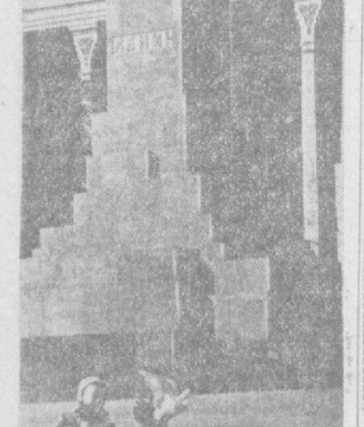
У лампачки Владимир Ильичу Ленину на площади В. И. Лениина в Ташкенте.