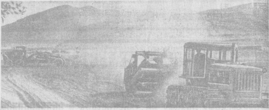
В Сурхандарьинской области сооружается Панжмарское водохранилище, которое позволит оросить целинные земли Гузарский степи. На снимке: один из участков стройки.