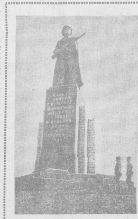
У Кушки, в урочище Чидухтер, стоит обычный красно-зеленый пограничный столб. Это самая южная точка Советского Союза.