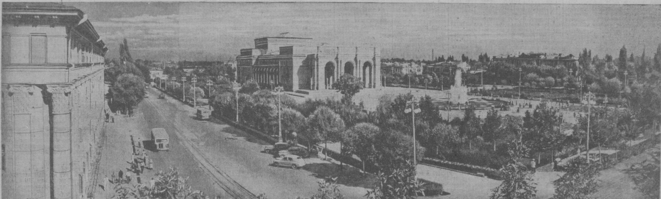
Ташкент. На снимке: Театральная площадь. В центре — здание Узбекского государственного театра оперы и балета имени Алишера Навои, в котором завтра открывается заседание научной сессии Академии медицинских наук СССР и Министерства здравоохранения Узбекской ССР.

В понедельник, 20 сентября, в 5 часов вечера в Ташкенте, в Узбекском государственном театре оперы и балета имени Алишера Навои, открывается научная сессия Академии медицинских наук Союза ССР и Министерства здравоохранения Узбекской ССР.