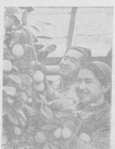
Богатый урожай лимонов зреет в тепличном комбинате сельхозартели имени Ленина Калининского производственного управления...